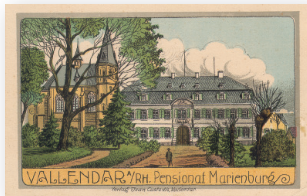
Ansichtskarte ehemaliges Haus d'Ester

Seit dem Jahr 1769 ist die Familie d'Ester in Vallendar nachgewiesen. Damals siedelte sich, auf Wunsch des Trierer Kurfürsten und Erzbischofs, der aus Malmédy/Belgien stammende angesehene Joseph Quirin d'Ester an. Auf dem Gelände einer aus dem 13. Jahrhundert stammenden Burg der Grafen zu Sayn-Wittgenstein errichtete er eine Lederfabrik und erbaute das bis heute wenig veränderte Wohnhaus. Das Haus d'Ester, ein spätbarocker, fast schlossähnlicher Bau, ist von einem Park umgeben und erlebte in der Folge eine wechselvolle Geschichte.