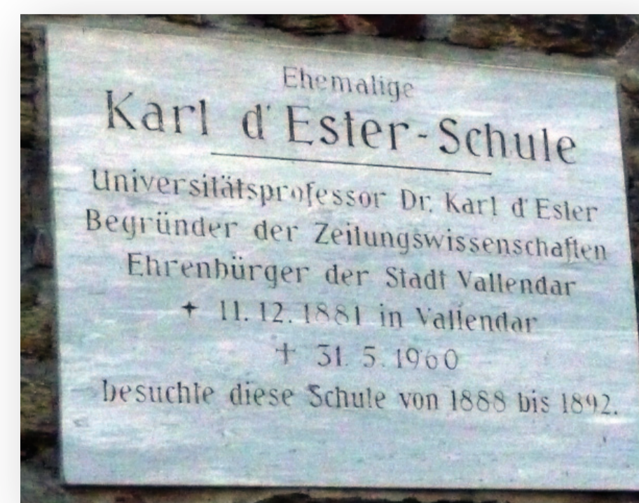
Gedenktafel an der Schule in Vallendar